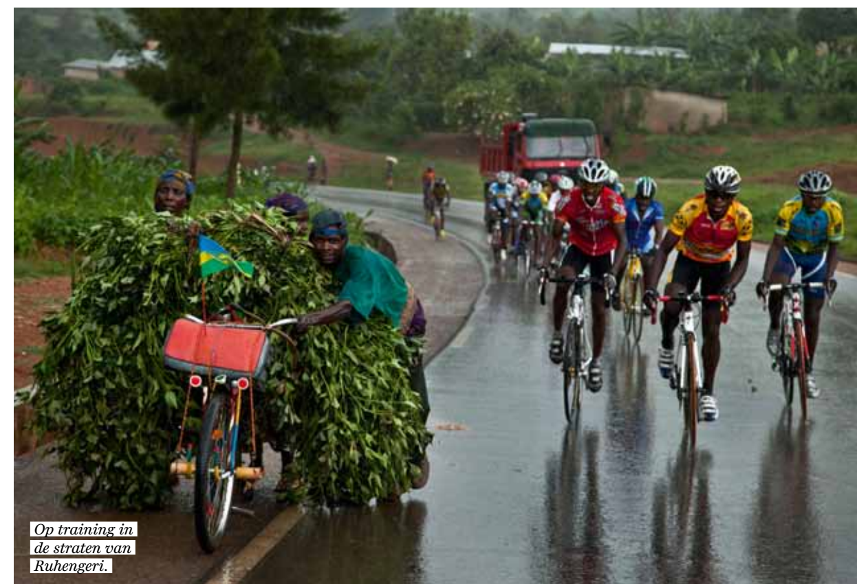
Op training in de straten van Ruhengeri.